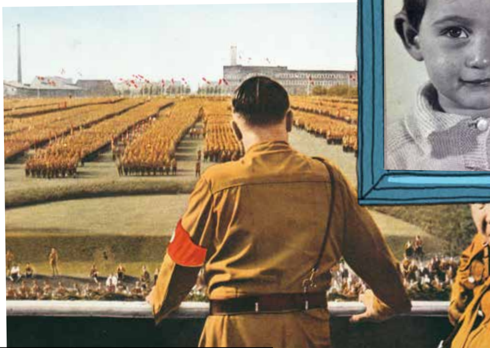
Adolf Hitler adresându-se susținătorilor săi la Dortmund (Germania), 9 iulie 1933.