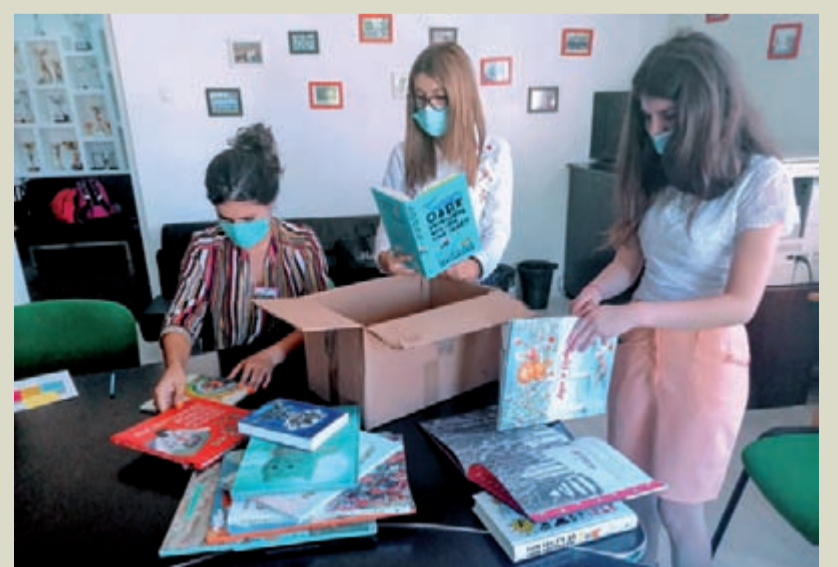
Cărțile Humanitas Junior au început să ajungă în școli.