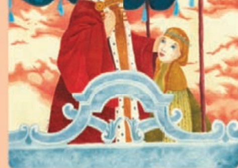
Ilustrație din volumul Visătorul de visuri al Reginei Maria, semnată de Sidonia Călin (Humanitas Junior, 2019).

Sidonia Călin: Ce se află pe masa ta de lucru?