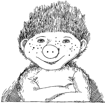
Acesta este Sambo